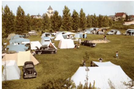
Que de chemin parcouru depuis le camping des années 60 et des années 80...