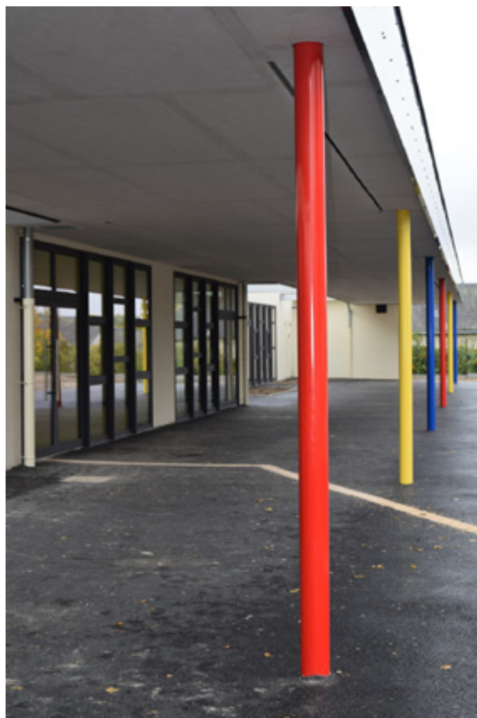
Adoptant un style et des teintes proches des groupes scolaires Fort et Rimbaud, le nouveau bâtiment du groupe Prévert complète harmonieusement un ensemble regroupant géographiquement toutes les classes de l'enseignement primaire dans notre commune.