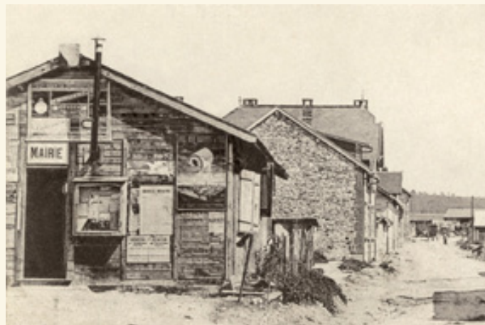
La mairie provisoire de Guignicourt est installée dans une baraque, située à l'angle de l'avenue de la Gare (aujourd'hui avenue Général de Gaulle) et de la rue de Prouvais (aujourd'hui rue Pierre Curtil), face à l'actuel bureau de tabac.