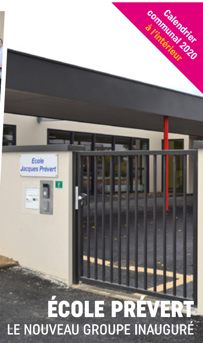
ÉCOLE PRÉVERT LE NOUVEAU GROUPE INAUGURÉ