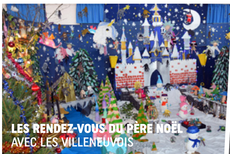
LES RENDEZ-VOUS DU PÈRE NOËL AVEC LES VILLENEUVOIS