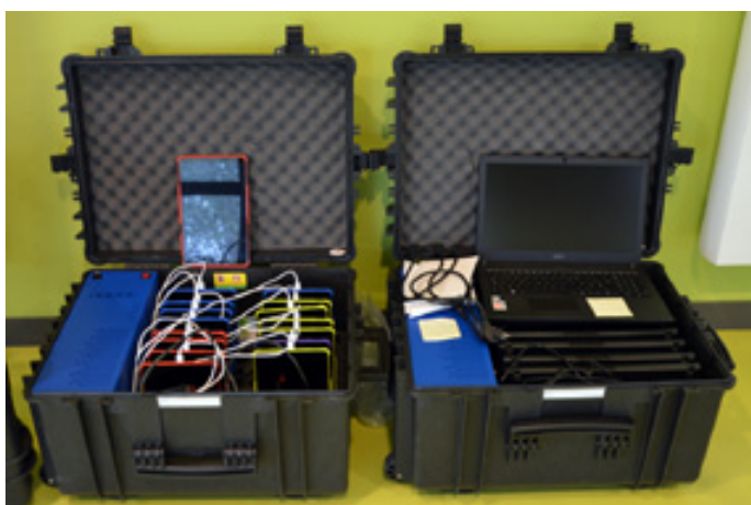
Grâce à cet ensemble de tablettes et l'installation de tableaux numériques interactifs, élèves et enseignants disposent d'outils pédagogiques performants.