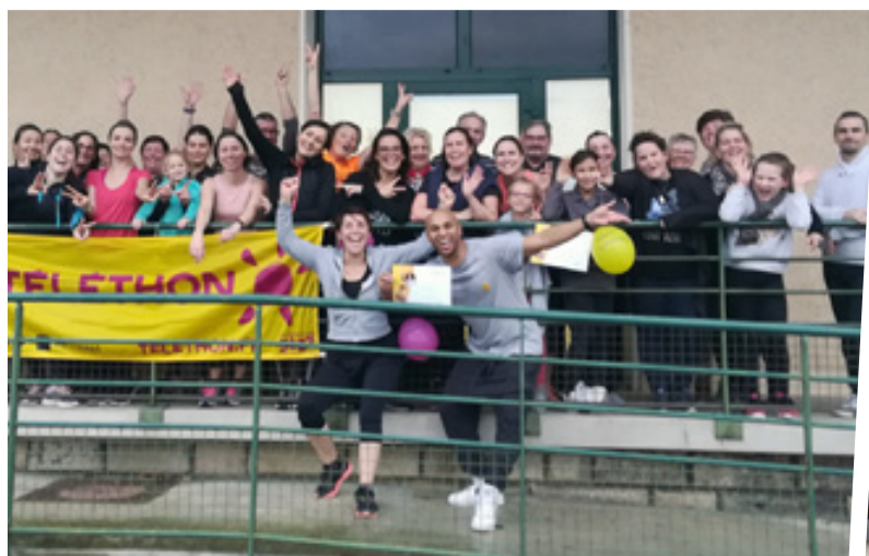
TÉLÉTHON 2019 BELLE MOBILISATION DES ASSOCIATIONS

BULLETIN COMMUNAL DE VILLENEUVE-SUR-AISNE • N°5 • JANVIER - MARS 2020