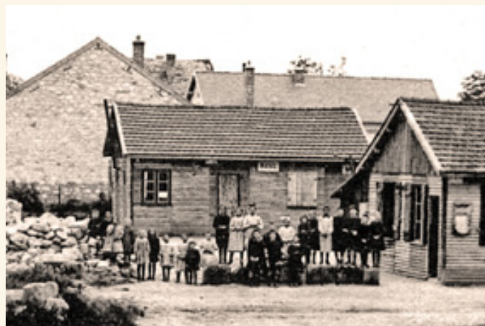
La mairie provisoire de Menneville. Le baraquement était situé en plein sur la place de la mairie actuelle. Le bâtiment définitif a été reconstruit à l'emplacement des tas de pierres, sur la gauche de la photo. La maison au fond se trouve 1 rue des Prés, elle est aujourd'hui habitée par M me Alice Lebeaux.