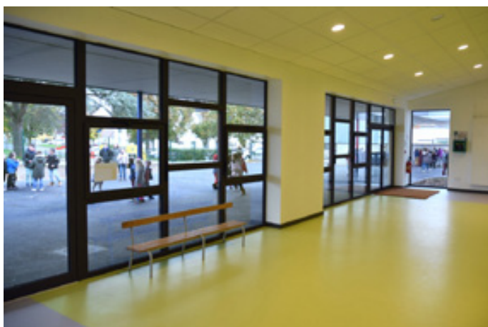
Vaste et lumineux, le hall de l'école disposé au cœur du bâtiment.